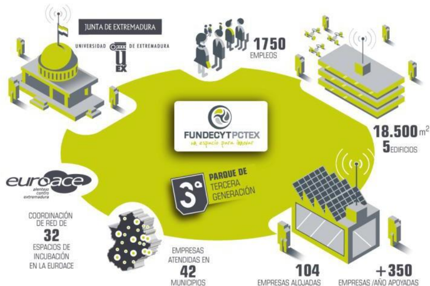
Cuadro de indicadores de FUNDECYT-PCTEX

Quedará pendiente un año más, la ejecución del Plan de Infraestructuras que contempla la ampliación del Parque con las nuevas instalaciones en los campus de Cáceres y Badajoz y una nueva sede en la ciudad de Mérida y cuya implementación deberá esperar a la existencia de financiación extraordinaria.